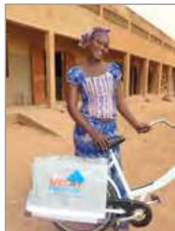
Foto voorzijde: jonge vrouw in Burkina Faso die van Tools To Work een fiets heeft ontvangen.