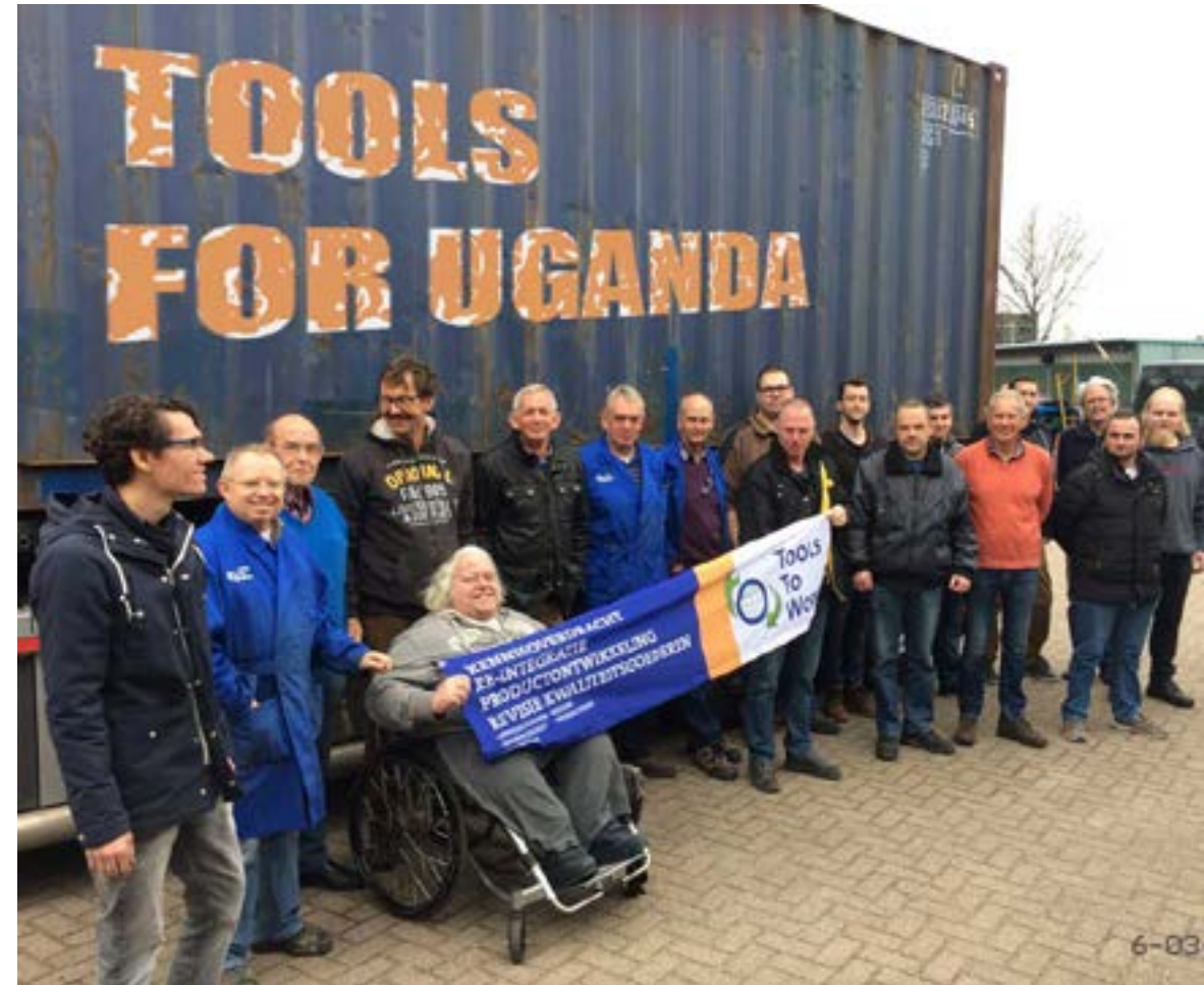
Foto: Vertrek van een zeecontainer naar Oeganda

Het scheppen van kansen aan mensen om zichzelf te ontplooiën is het centrale thema van Tools To Work. Hierin past ook onze samenwerking met Stichting Leergeld, die schoolmiddelen zoals fietsen en computers verstrekt aan gezinnen in Nederland met een krappe beurs. Ook het geven van trainingen over onderhoud en reparatie van de geleverde machines in Afrika, maakt deel uit van ons streven om mensen op eigen benen te laten staan.